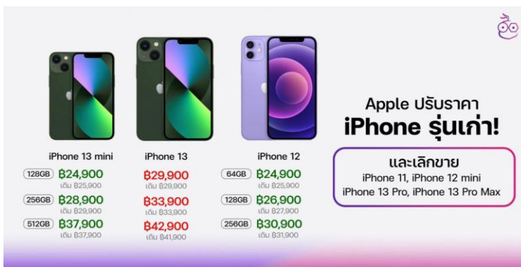
Fig 4: iPhone 12 and 13 price reducing