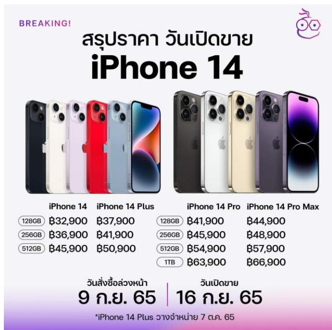
Fig 3: iPhone 14 Pricing