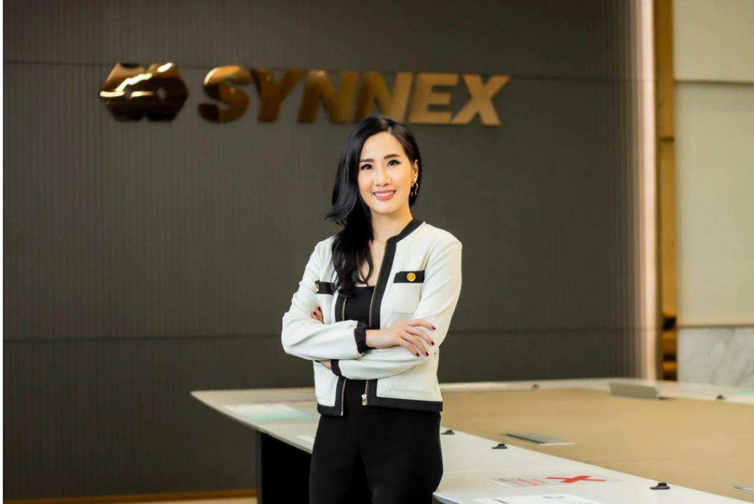
SYNEX ปลายปีผลงานรุ่งฉิว รับเทรนด์เทคโนโลยีเปลี่ยนโลก

อีกหุ้นเทคโนโลยีที่โดดเด่นเข้าตานักลงทุน ต้องยกให้ บมจ.ซินเน็ค (ประเทศไทย) หรือ SYNEX ที่กระแสแรงส่งท้ายปี และผลงานแรลลี่บวกอย่างต่อเนื่อง แนวว่าไฮซีซั่นในช่วงQ4/64 มีแต่ข่าวดีมาบอก ยอดขายสินค้าไอทีและสมาร์ตโฟนที่ทยอยเปิดตัวและวางจำหน่ายในช่วงที่ผ่านมา ได้รับความตอบรับจากผู้บริโภคเป็นอย่างมาก ขณะที่ มาตรการภาครัฐกระตุ้นเศรษฐกิจหนุนการใช้จ่ายใช้สอยปลายปีคึกคัก แกรมช่วง 25 – 28 พฤศจิกายนนี้ ซินเน็คฯ ยกทัพสินค้าร่วมงาน COMMART 2021 มหกรรมงานไอทีที่ใหญ่ที่สุดของประเทศ สนับสนุนโค้งสุดท้ายผลงานรุ่งฉิว นี้ยังไม่นับรวมแผนการต่อยอดธุรกิจ หรือจับมือพันธมิตรรายใหม่ๆ ที่จะเข้าเสริมความแข็งแกร่ง ยกกระดับธุรกิจสู่ไอทีอีโคซิสเต็มได้ตามแผนที่วางไว้