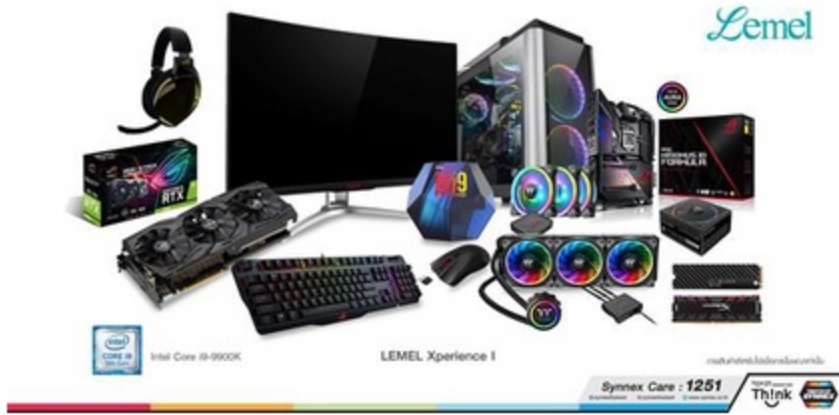
ดูรูปทั้งหมด

ข่าวเทคโนโลยี ThaiPR.net -- พฤษภาคมที่ 6 มิถุนายน 2562 15:34:40 U.