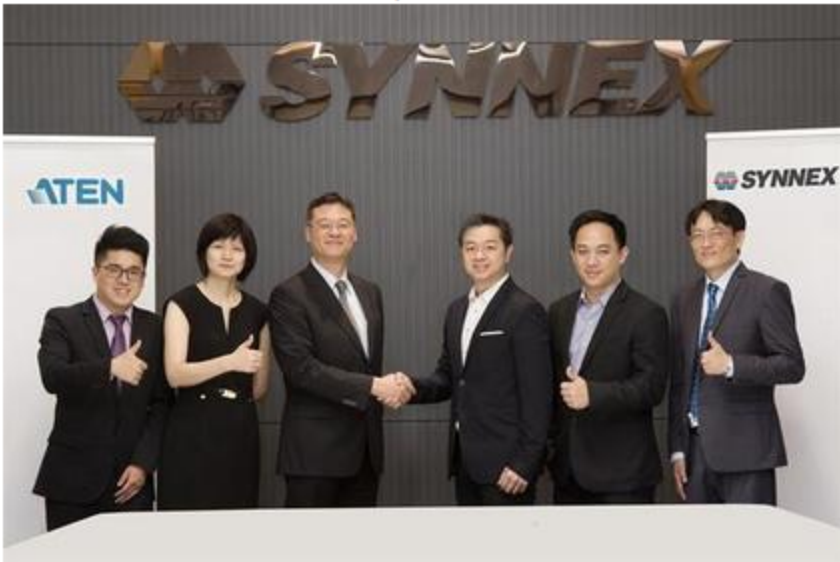
ครบทั้งหมด

ข่าวเทคโนโลยี ThaiPR.net -- ศุกร์ที่ 8 ธันวาคม 2560 14:12:21 น.