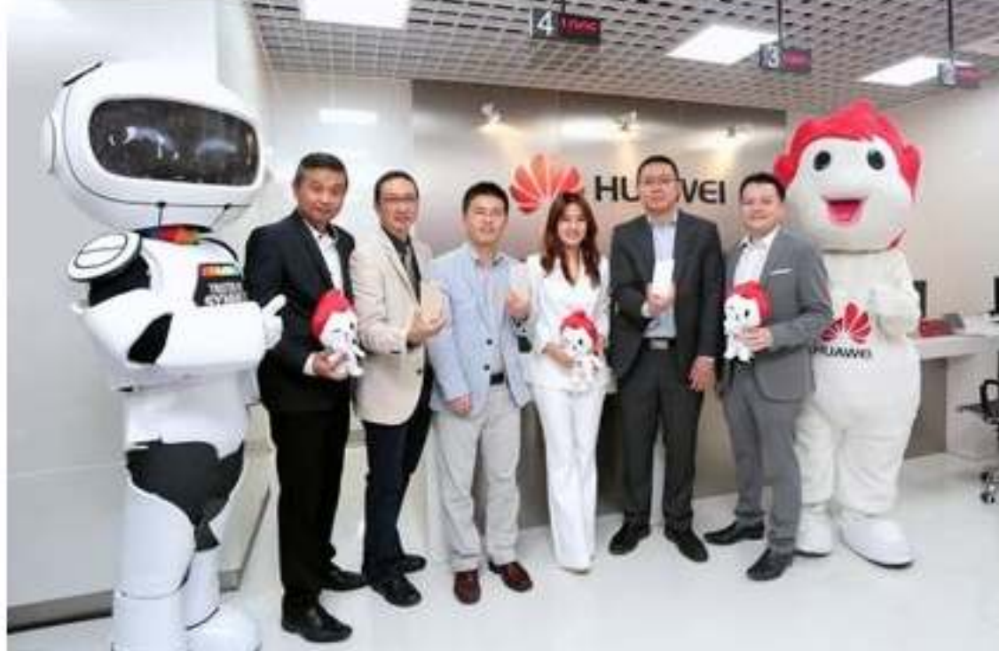
รูปทั้งหมด

ข่าวเทคโนโลยี ThaiPR.net -- จันทร์ที่ 22 สิงหาคม 2559 17:30:52 น.