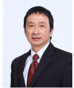
เสนอเป็นกรรมการ