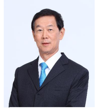
เสนอเป็นกรรมการอิสระ