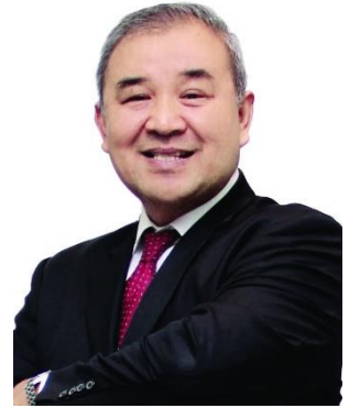
เสนอเป็นกรรมการอิสระ